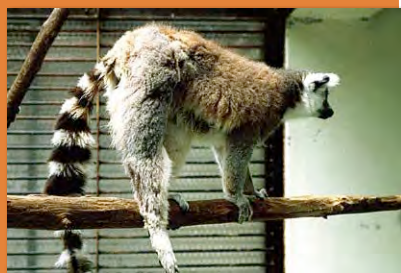
サル類の疾病カラーアトラス

SIV感染における脾腫、脾腫、脾腫と多発性巣状壊死 (エルシニア症)、ミクロフィラリアによる結節性脾病変、ミクロフィラリア、エキノコックス症、リンパ節膿瘍、SIV感染におけるリンパ節の腫大、ホジキン病様リンパ腫、リンパ腫、白血病